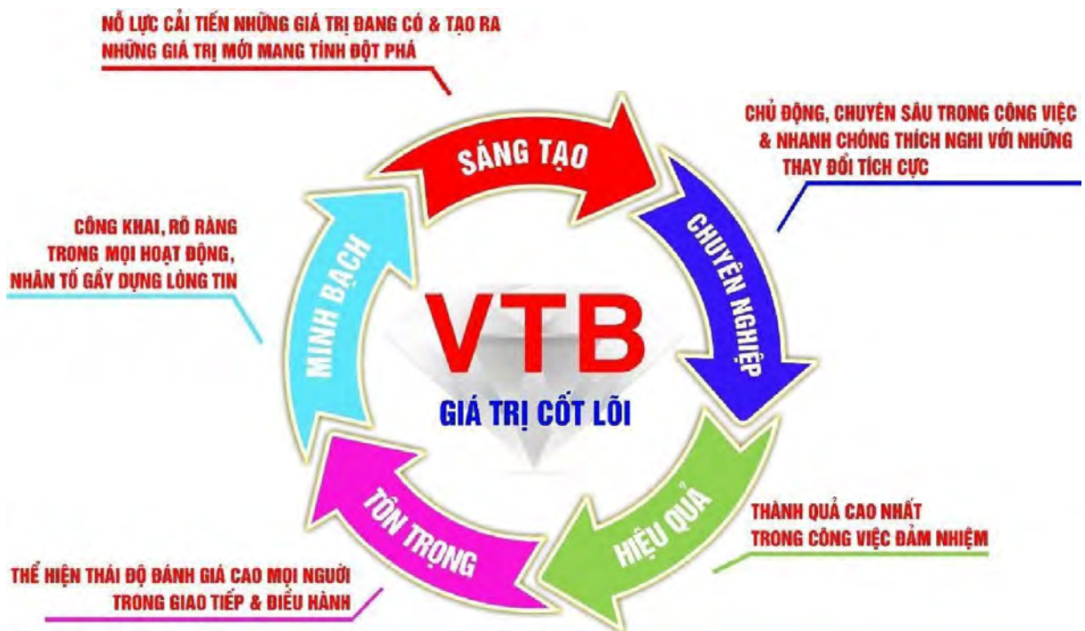
Giá trị cốt lõi VTB