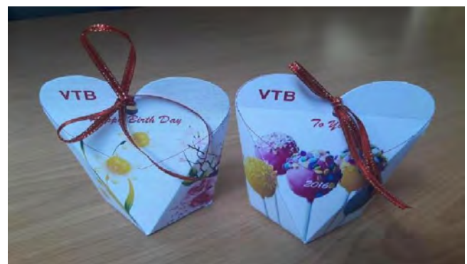
Quà sinh nhật cho cán bộ nhân viên VTB