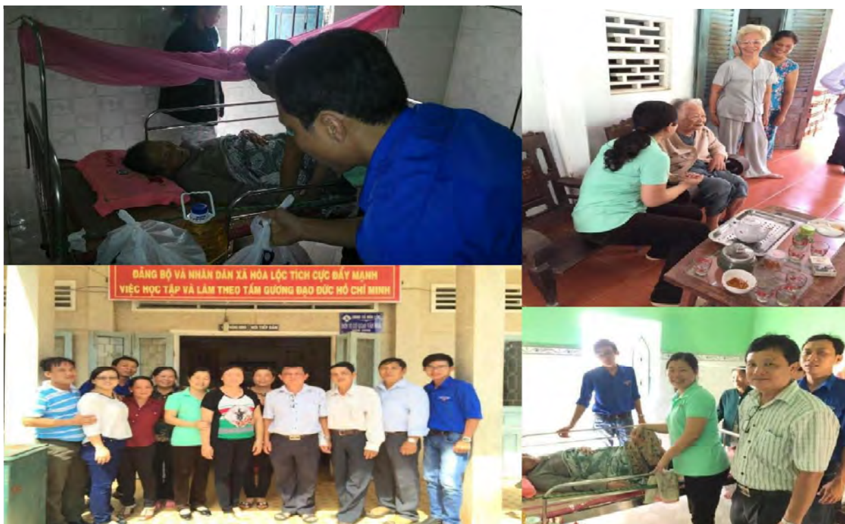
Hoạt động đền ơn đáp nghĩa của VTB