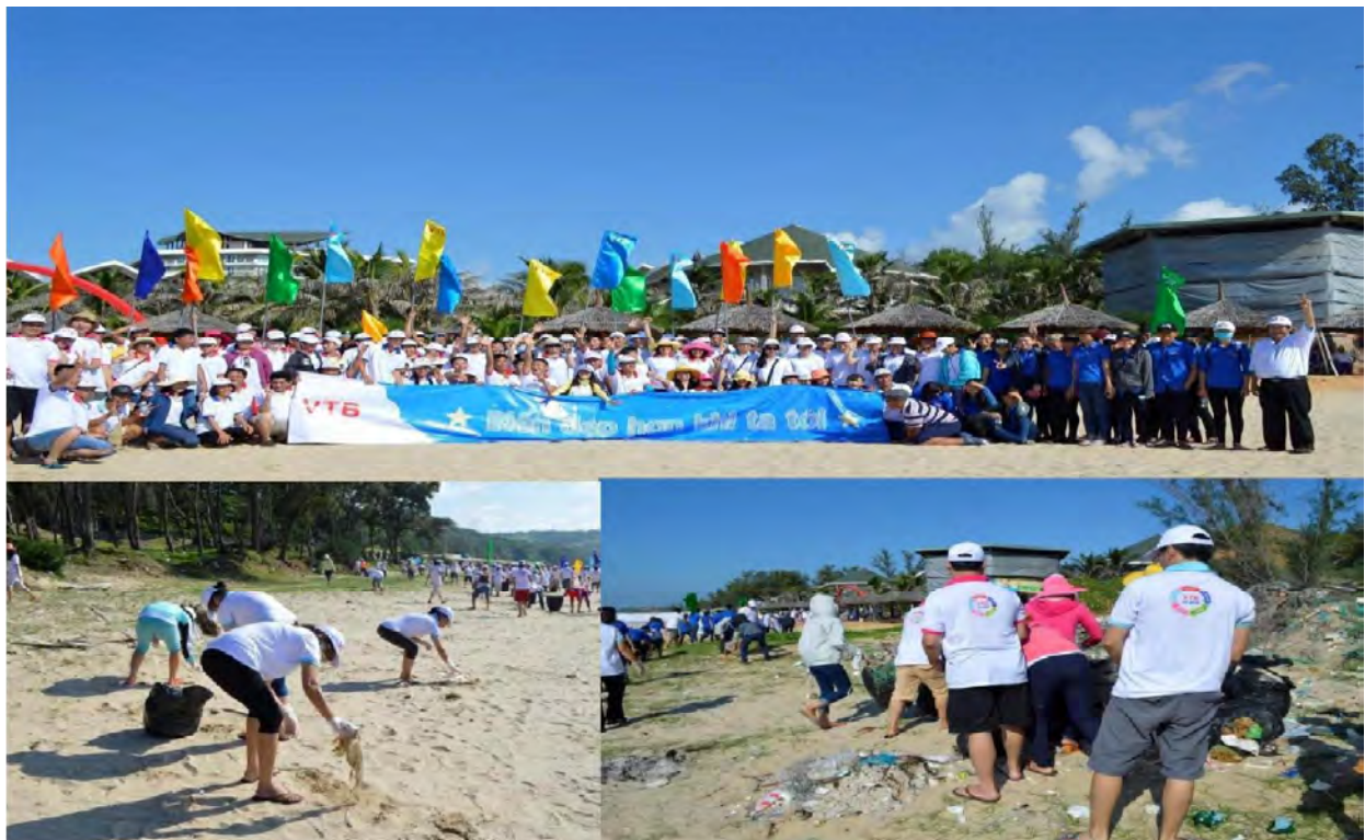
Hoạt động bảo vệ môi trường của VTB